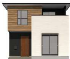
洗練された都会的な モトーンスタイル

寄棟屋根、外壁の凹凸で水平ラインを美しく整えました。ブランドアイコンの四つ窓が個性を引き立てます。四種類のカラーコーディネートの中から、ライフスタイルに合わせてお選びいただけます。