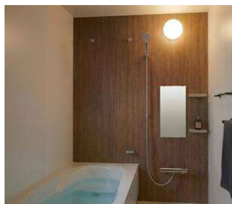
一日の疲れを癒す 広々バスルーム。 浴室換気乾燥暖房機付き。