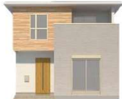
光を纏う 北欧ナチュラルスタイル