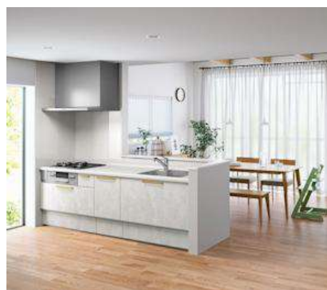
対面キッチンで料理中も 家族の会話が弾みます。