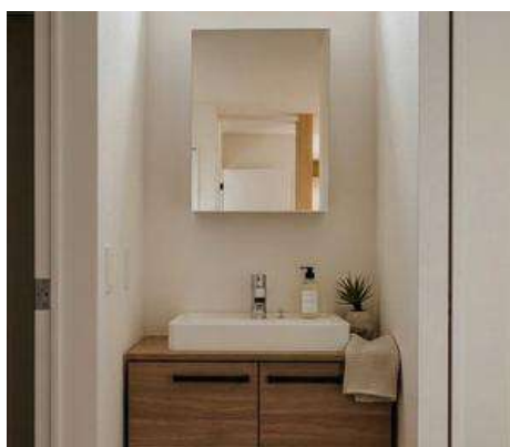
家具のようにインテリアになじみやすい カウンタータイプ。 作業性に優れたデザインボウルを採用。