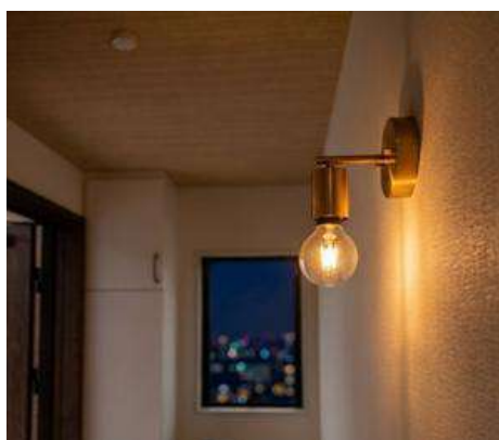
柔らかい光のブラケットライトが あなたの帰りを迎え入れます。