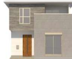
重厚感あるれる アーバンストーンスタイル