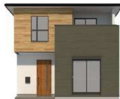
自然と調和する アースモダンスタイル