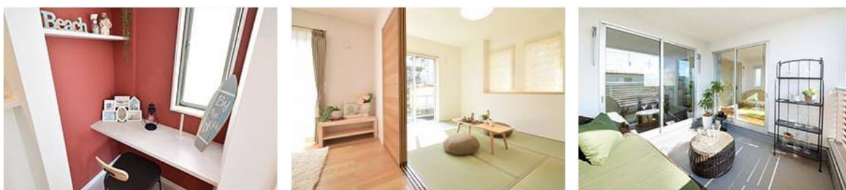
※画像はイメージとなります

・親子で学ぶ時、子育ての時、お天気の時、コーディネートの時。ココロに花が咲く工夫を随所に施しました。