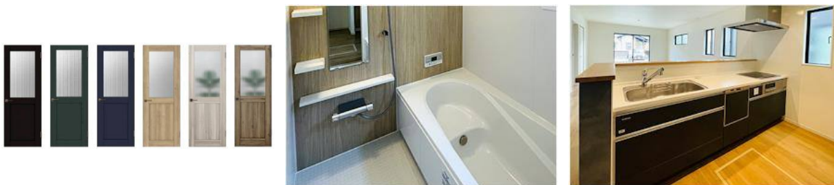
※画像はイメージとなります