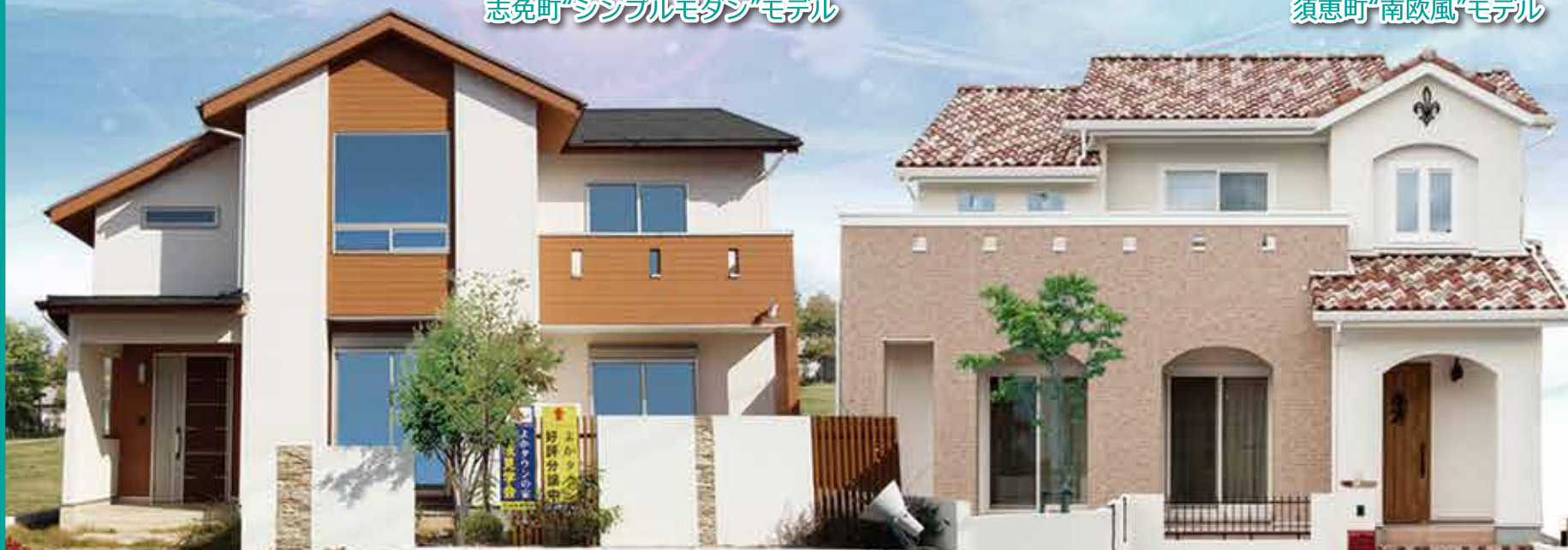
須恵町“南欧風”モデル