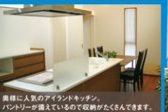
奥様に人気のアイランドキッチン。パントリーが備えているので収納がたくさんできます。