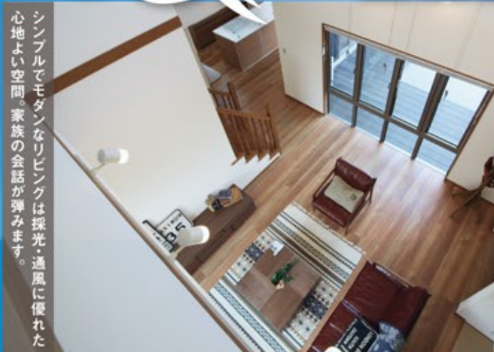
シンプルでモダンなリビングは採光・通風に優れた心地よい空間。家族の会話弾みます。

お客様のニーズを把握し、お客様にとってベストで経済的な商品を提供します。変化する政策などを有効利用しながら、資金、返済のバランスなどをコンサルティング。よかタウンが販売するのは、住まいだけではなく、お客様の一生を見据えたファイナンシャルプラン(財務プラン)です。