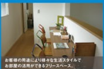
お客様の用途により様々な生活スタイルでお客様の活用ができるフリースペース。